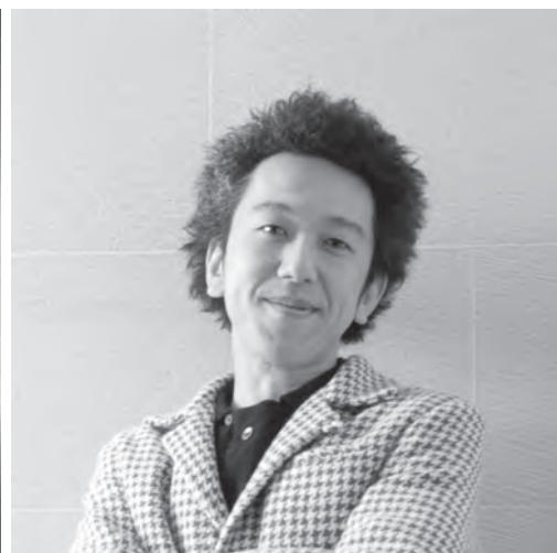
酒匂 克之 さこう かつゆき

1971 大阪生まれ。 1997 東京造形大学 造形学部デザイン学科卒業 1997-2001 近藤康夫デザイン事務所勤務 近藤康夫氏に師事 2002 丘の上事務所を設立 2009-2015 デザインユニット MITIITO