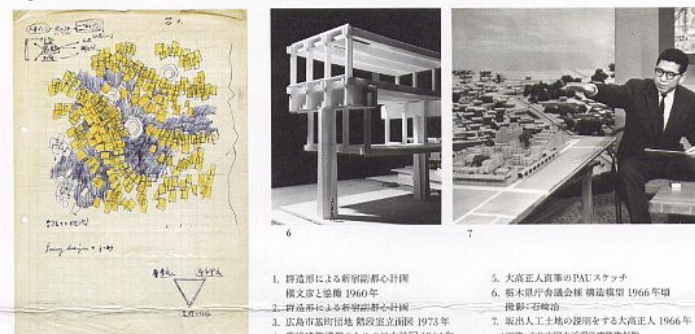
1. 評選形による新宿駅前計画 模写文庫館 1960年 2. 評選形による新宿駅前計画 模写・石塚誠 3. 広島市基町団地 建設直立図面 1973年 4. 豊後建築模型のたりの日本地図 1964年 5. 大高正人直筆のPAUスケッチ 6. 栃木県庁舎建設模範 1966年頃 7. 阪出人工土地の説明をする大高正人 1966年