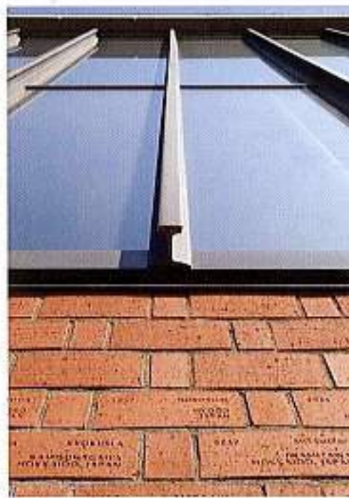
古レールと刻印レンガ