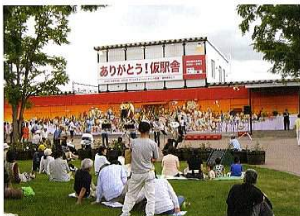
「ありがとう！仮駅舎」イベント風景