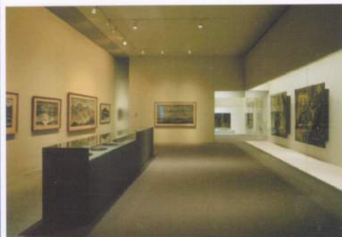
展示室内部 漆作品の保護のため通常よりも、照度・色温度を落とした照明計画としている