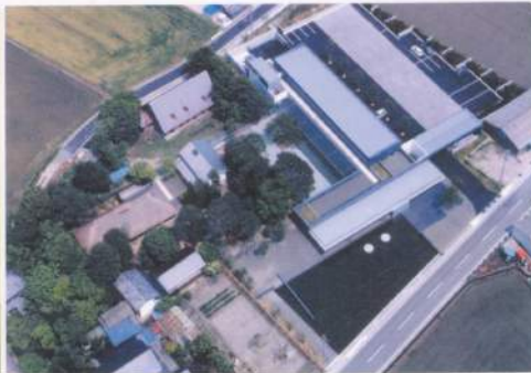
美術館全景 古民家が群として残っているのは安曇野でもめずらしい風景である