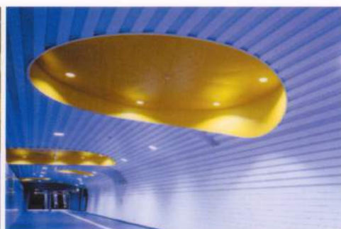
地下1階道路横断施設（新高島駅）