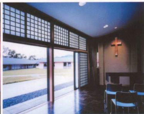
小聖堂より中庭を望む