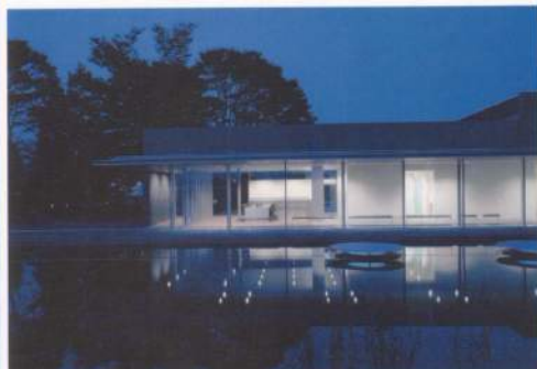
安曇野の樹木と清純な沸水を積極的に取り入れ、美術館の背景に活かす