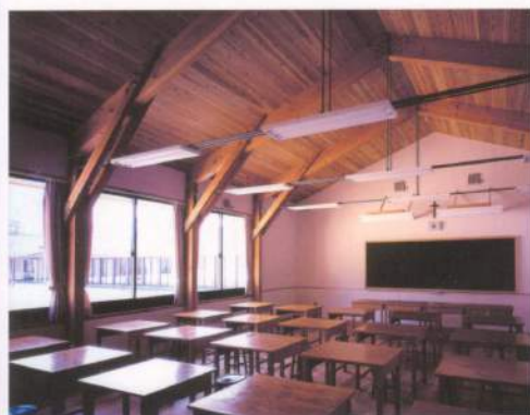
木のぬくもりを感じる教室内部