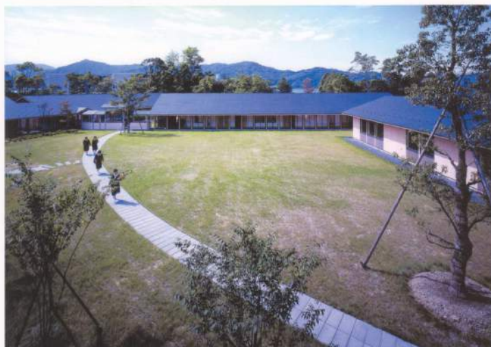
「人と自然が向き合う中庭」を、分棟化された校舎と回廊が囲んでいる