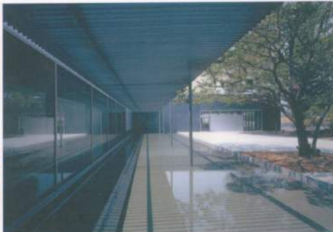
ギャラリーより水庭・石庭を望む 桜の古木をそのまま残している